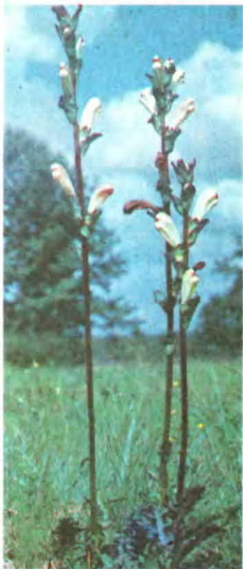
763. Шолудивник королівський.